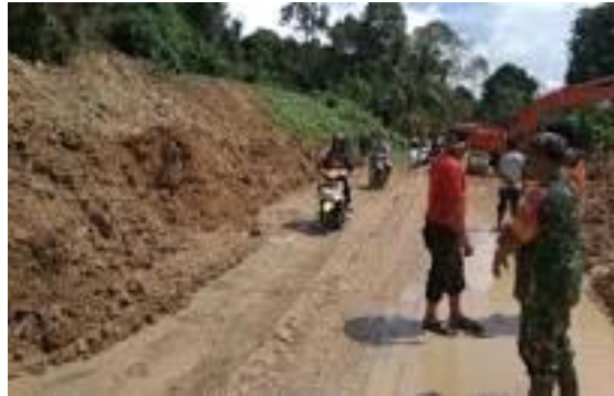
Gambar 3. Jalan Berkat menuju Kecamatan Sipora Utara (Tuapejat) Tahun 2019